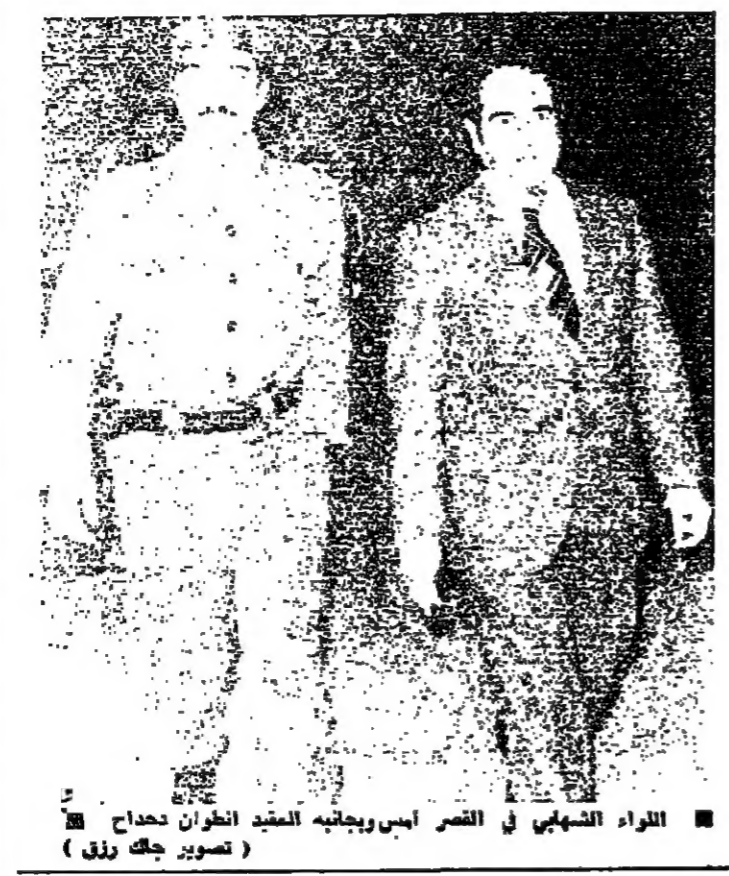
الواء الشهابي في القصر امين وجانبه العميد انطوان خدام

وقف الخط بين الحرب والارمة الواء حكمت الشهابي ليس في وقتها عن اورشليم - فهو يعرف عما يجري في لبنان اكثر مما تعرف الدولة - ويعرف من الحل اكثر مما يعرف المختارون - وسواء كانت مهنة في اعداد المرضى في غرفة العمليات بانتظار وصول الدكتور خدام ام كانت اقل من ذلك او اكثر ، فانها تلتقي في الوقت المناسب . ذلك ان الطريق بين القصر والسراي حذرة ، والطريق بين القصر والوزارة مقطوعة ، والطريق بين السراي ووزارة الداخلية في الشارع حذرة في كل وقت ، والطريق بين الرئيس كرامي والصحافة مملوءة بالحواجز - والطريق بين كرامي وخطه ، سلكة على خط واحد . والمشكلة ليست في فتح هذه الطرق ، فقد اصعبت اكثر من مرة سلكة واحدة ، والواء الشهابي شاهد على ذلك . لكن الحقلية الجينية لم تتوقف بل كالتكبير ، لماذا ؟ لان سبب وسبب ، لكن انهما هو ان طريق الدولة ليس الحكم فلك مقطوعة ، فلا الدولة تحت الطريق بالقوة ، ولا الذين يهبوا الحكم ويقبضونه اعادوا السور بالترشيح . ولا الرئيس كرام في بيروت كان يكلم اكثر من التسمية ، وانما اشجرت تشبه التي يبسها البعض مله الصراخ بالترشح .